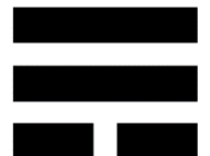
Parlamentarisch bis zu 16 Personen

WLAN (komDSL 50.000 / an- und abschaltbar) zusätzliche Internetanschlüsse im Seminarraum