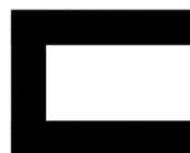
U-Form bis zu 18 Personen (außen sitzend)